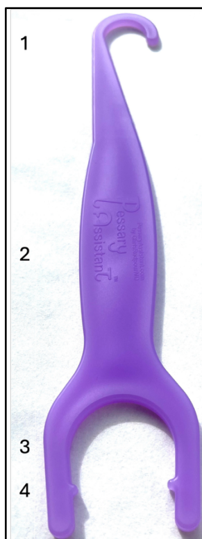
FIGURE 1. Composants de l'appareil PessaryAssistant™ :

PessaryAssistant™ se compose d'une poignée avec deux extrémités fonctionnelles, comme illustré à la Figure 1 ci-dessous :